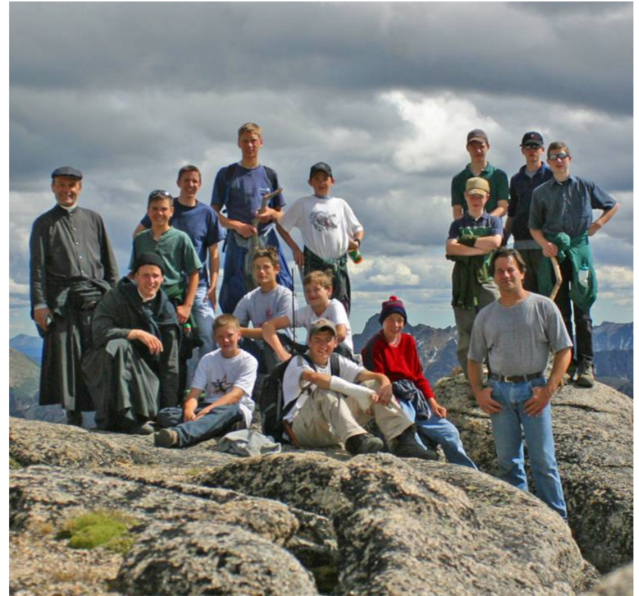
Camp de la Croisade Eucharistique en Colombie-Britannique