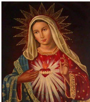
Le cœur Dououreux et Immaculé de Marie